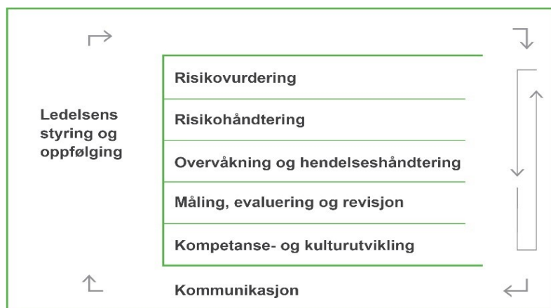
De syv områdene med systematiske aktiviteter i Difis forklaringsmodell for internkontroll. De ulike aktivitetene skal utføres av ulike aktører rundt om i virksomheten

De ansatte må ha klare roller og ansvar i internkontrollarbeidet. Lederne i linjen vil alltid ha et hovedansvar. Det er de som har ansvar for arbeidsoppgaver og mål, og dermed risikoene i virksomheten. Fellesfunksjoner gir støtte: de som leverer sikkerhetstiltak (IT-drift, bygningsansvarlig mv), de som veileder i vurderinger av risiko, og en fagansvarlig som følger opp helheten.